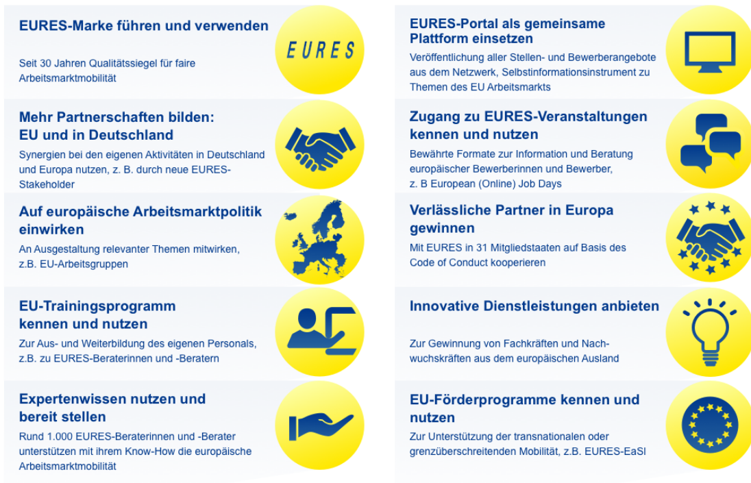
Abbildung 2: 10 gute Gründe

EURES öffnet die Tür zu den europäischen Arbeitsmärkten