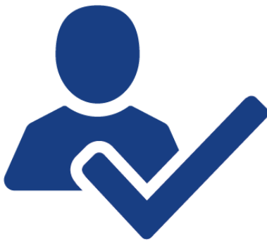
Abbildung 1: Icon EURES-Zulassung